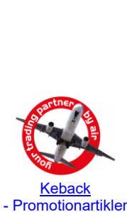
Keback - Promotionartikler