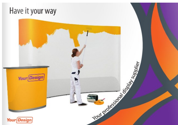
Xpo - Skilte og messeløsninger - efter Deres krav