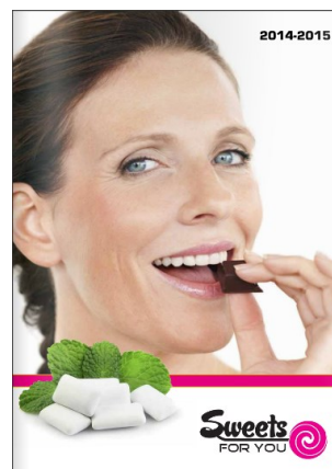
Slik og chokolader - Sweets4you - fra lager og i produktion