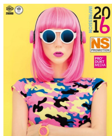
NS Promotion - Impressions til ethvert event - med tiltrykt budskab

Se mere om mulighederne på vor hjemmeside: www.5610.eu > www.danskerhvervsbeklaedning.dk